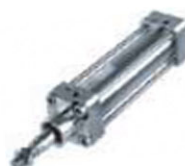
Cilindros en acero inoxidable