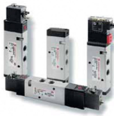
Válvulas en línea serie V60