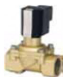
Válvulas de membrana con accionamiento eléctrico