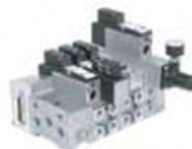
Isla de válvulas y sub-base