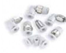
Pneufit M -Miniatura-