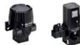
Convertidores electrónicos I/P