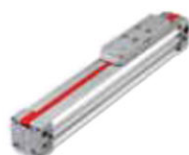
Cilindros sin vástago "Lintra"