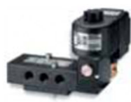
Válvulas de accionamiento indirecto