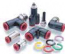
Pneufit C -Plástica -