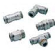
Pneufit S -Inox -