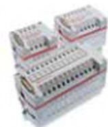
Isla de válvulas VM10

Nuestras válvulas ofrecen un diseño compacto y robusto con un amplio rango de flujo, así como gran durabilidad y fácil instalación por lo que son la mejor opción para cualquier aplicación industrial, además de contar con una extensa variedad de montajes, accionamientos y conectores eléctricos, incluyendo la mayoría de los protocolos de comunicación (Fieldbus, Modbus, Profibus, Multipolo, entre otros). Fabricamos válvulas para aplicación en línea, con sub-base e islas de válvulas de alto rendimiento.